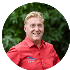
Kris Thys Sponsors | TMAB Business Events

+32 (0)4 75 59 11 83 begeo@tmab.be – kts@tmab.be